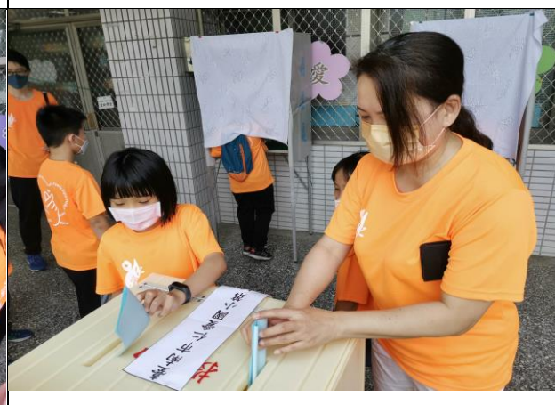
說明：親師生共同參與。