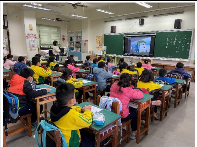
說明：低年級教師進行宣導。