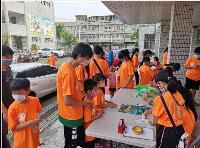
說明：身分查證，登記領票。