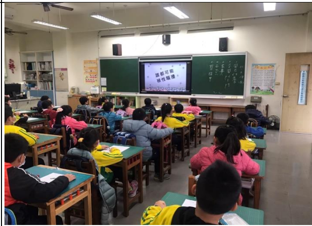
說明：低年級教師進行宣導。