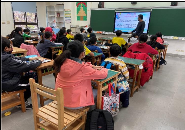
說明：中年級教師進行宣導。