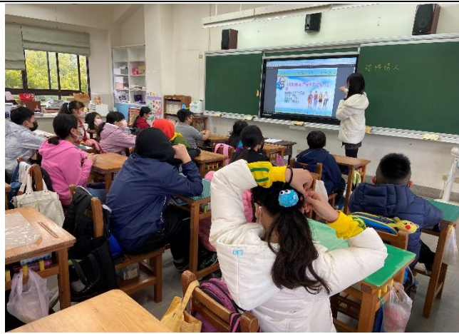
說明：高年級教師進行宣導。