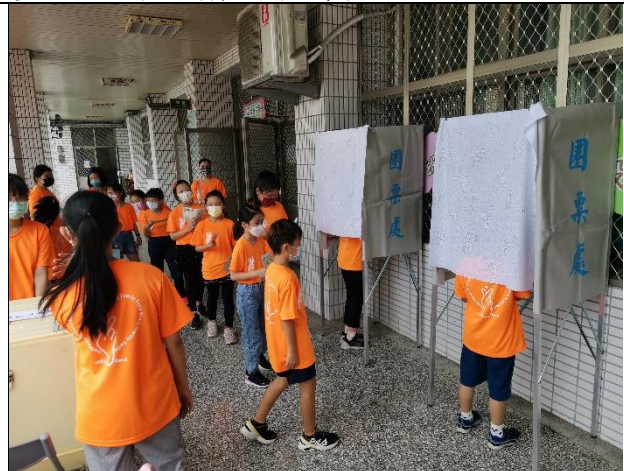
說明：排隊等待圈票。